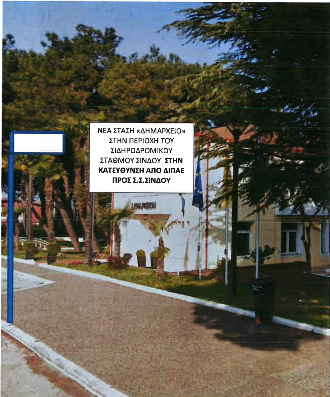
Εικόνα 1: Νέα στάση «ΔΗΜΑΡΧΕΙΟ» στη διαδρομή της γραμμής Νο 53Σ «ΔΙ.ΠΑ.Ε-Σ.Σ.ΣΙΝΔΟΥ-Γ ΦΑΣΗ ΒΙ.ΠΕ.Θ.» στην περιοχή του Σιδηροδρομικού Σταθμού Σίνδου